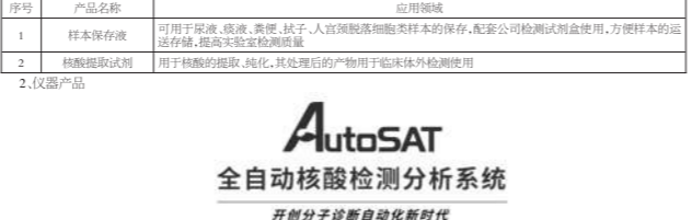
全自动核酸提取分析系统 AutoSAT

2. 报告期公司主要业务简介 (1) 主要业务、主要产品或服务 公司目前主要业务为核酸提取试剂的研发、生产和销售,主要产品为核酸提取试剂(SAT)和核酸检测试剂(RNA)。