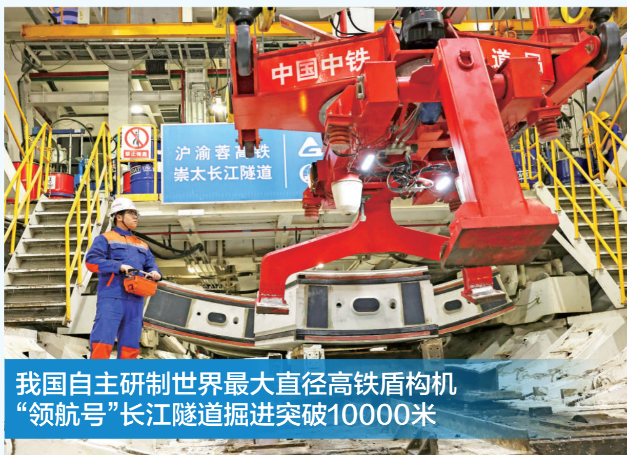
我国自主研发世界最大直径高铁盾构机 “领航号”长江隧道掘进突破10000米

12月16日，我国自主研发的世界最大直径高铁盾构机——崇太长江隧道“领航号”掘进突破10000米大关，越江隧道工程取得阶段性进展，为全线贯通奠定坚实基础。