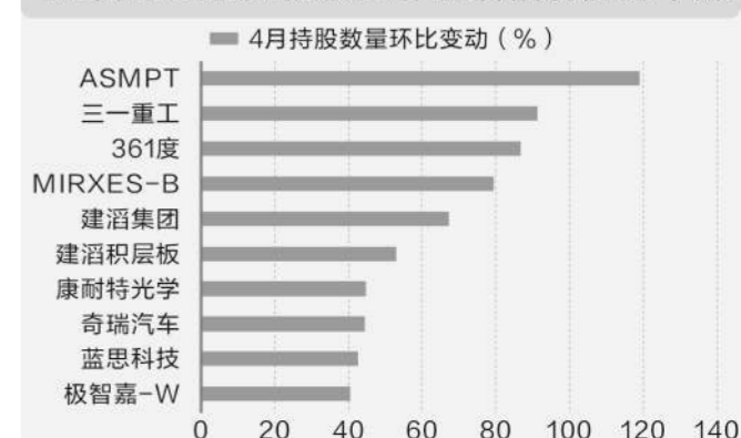
(本版数据由证券时报中心数据库提供)