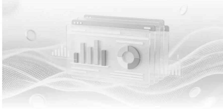
主动“晒订单”且机构密集调研的绩优潜力公司