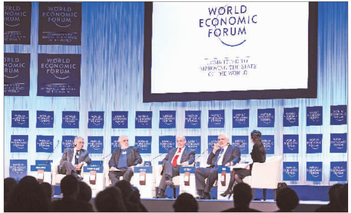
第42届达沃斯经济论坛的某一分会场

不过，欧元支持者也有人在。德拉吉也在达沃斯公开表示力挺欧元，爱尔兰、波兰、丹麦和芬兰四国首脑均表示将支持欧元。