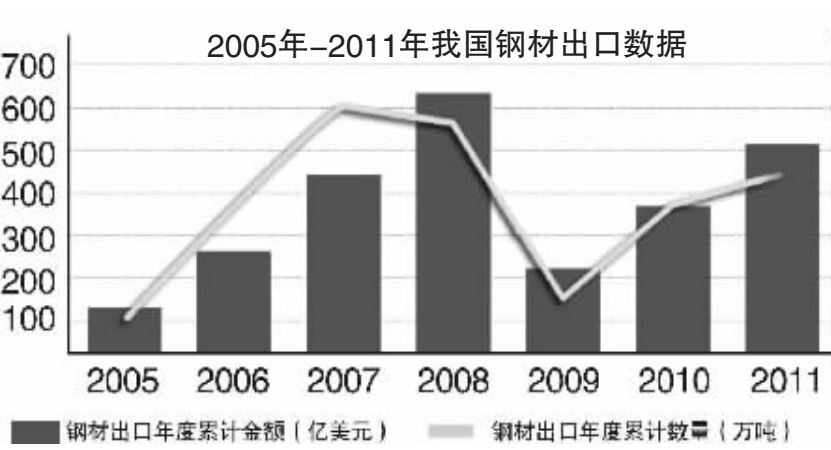
数据来源:同花顺iFinD 向南/制表 吴比较/制图

中国加入世界贸易组织之后，外贸出口为经济增长做出了很大贡献，有很多企业专作为出口而建，但专家们认为这种模式难以在钢铁行业复制。