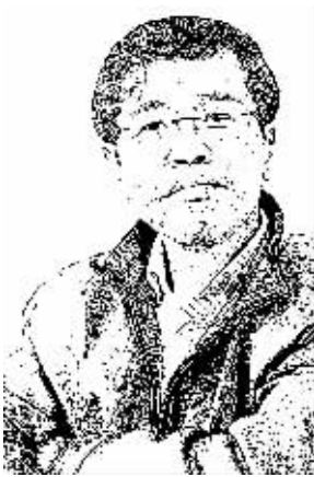
证券时报记者 肖国元

十八届三中全会的召开，标志着我国的改革开放又迈上了一个新台阶。其标志就是改革突破了过去的局部性、单一性与试探性，在总结过去 35 年经验教训的基础上，定调“全面深化改革、整体推进”。确定这样的基本思路，不仅肯定了过去的成功经验，也昭示了未来的改革重任。由此，我们可以大胆设想证券市场的美好未来。