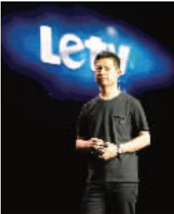
乐视以网络思维 颠覆传统电视