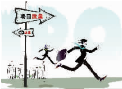
投行告别 IPO项目“GDP”崇拜