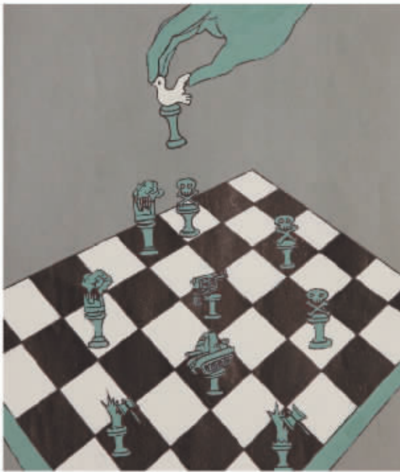
深圳赛区特等奖《如何走对人类的下一步棋》