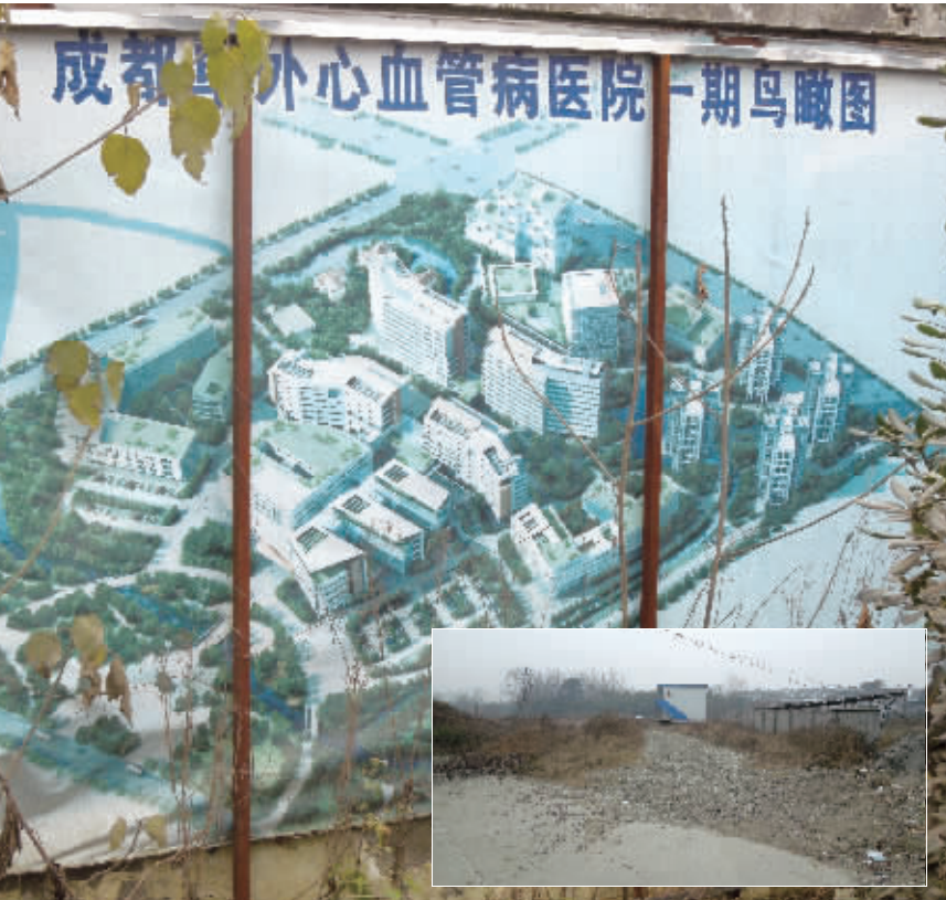
荒凉的成都阜外心血管病医院一期工地(小图)和工地围墙上褪色的项目效果图(大图)

在一片围墙围起来的空地上,除了杂草外,只有一些木头、钢筋等建材,未见施工人员,两层楼的工棚也见不到人,只有一位看守建材的老人。围墙外张贴的多张规划图已字迹模糊、破旧不堪,只能隐约看到成都阜外国际医疗休闲小镇字样的规划图以及成都阜外心血管病医院一期的鸟瞰图。对比鸟瞰图的宏伟,这一空地颇显荒凉。