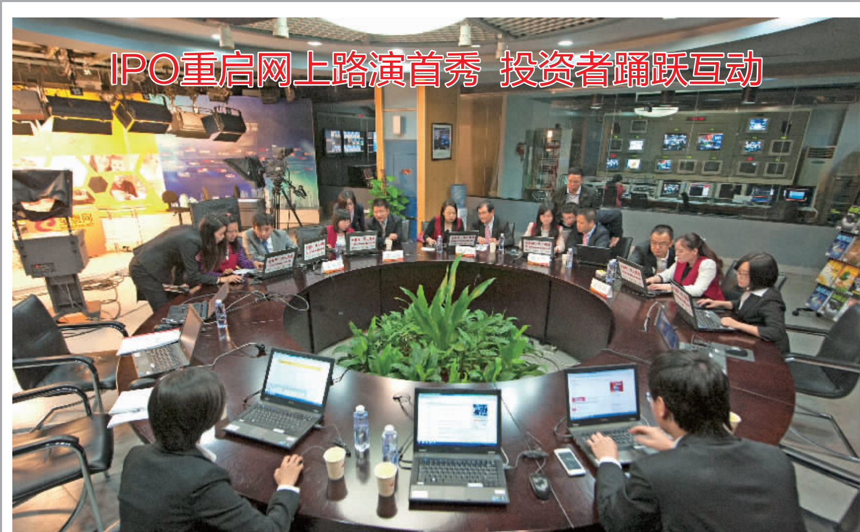
IPO重启网上路演首秀 投资者踊跃互动 恢复新股发行后的首场新股网上路演昨日在全景网举行，我武生物和新宝股份董事长、董事、财务负责人、董秘和保荐机构相关人员参加了路演，围绕发行人基本情况、发展前景和本次发行的有关安排与投资者进行互动交流。在 3 个小时的交流活动中，共回答投资者提问逾 450 个。图为新宝股份路演现场。

当事人不公平对待保险资金等行为，保险业相关协会组织应当实行负面清单管理制度。 保险资金运用市场化是保监会重大改革举措之一。去年 10 月，保监会下发《关于加强和改进保险资金运用比例监管的通知（征求意见稿）》，提出“多层次比例监管框架”概念，险资权益类投资上限有望从 25% 提至 30%，不动产投资比例放宽至 30%。 据保监会最新数据，2013 年前 11 月，保险资金运用余额为 74683.11 亿元。其中，股票和证券投资基金 7555.83 亿元，占比仅 10.12%。