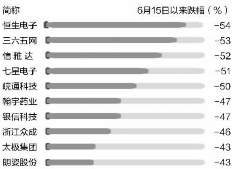
领跑基金连续四季持有且大跌以来跌幅居前个股(剔除停牌)