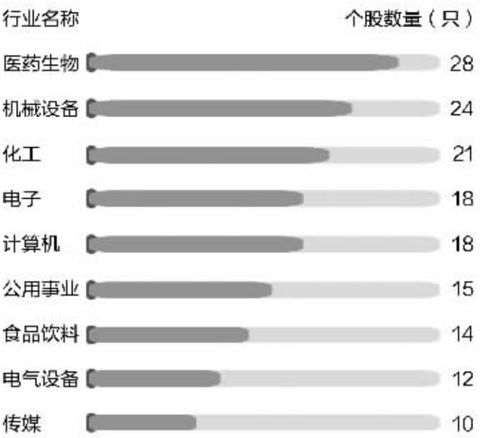
二季度领跑基金新进股主要行业分布