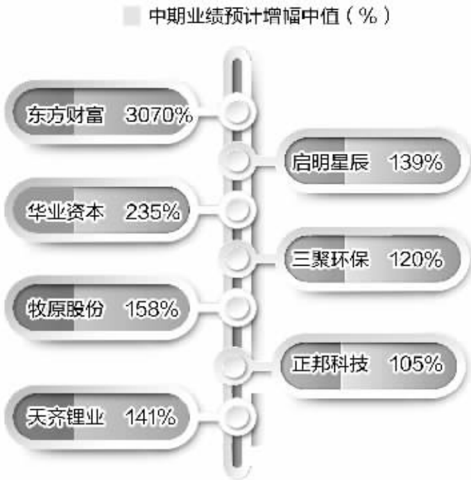
领跑基金连续四季持有且中期预计翻倍个股