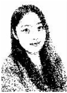
证券时报记者 孙璐璐