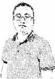
证券时报记者 罗克关

该走的总是会走，该来的也一定会来。昨日美联储如期宣布将基准利率上调 25 个基点，正式终结了次贷危机以来这一轮接近 10 年的美元降息周期。