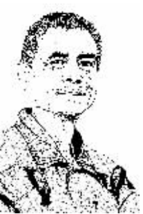
证券时报记者 吴智钢

周一央行意外宣布降低存款准备金率0.5个百分点,引发市场各方的热议。有股市投资者认为,这是一种救市的措施。