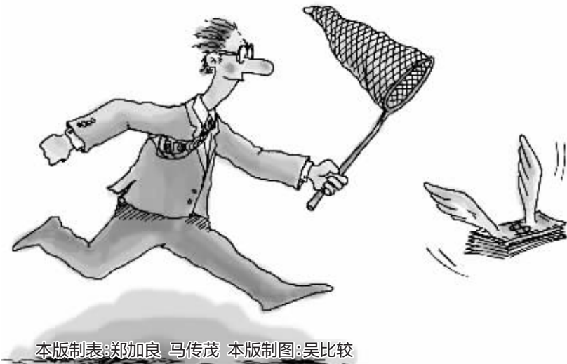
本版制表:郑加良 马传茂 本版制图:吴比较

2 月 15 日,长安信托称,公司注册资本金由 13.46 亿元增加至 33.3 亿元,